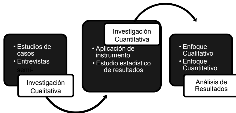
Figura 2: Fases genéricas del proceso de la investigación